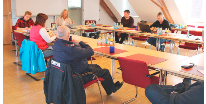
Der Lenkungsstab der Stadt Tauberbischofsheim hat sich am Wochenende mehrfach getroffen, um Maßnahmen zum Schutz der Bevölkerung zu besprechen.

Für aktuelle Änderungen informieren Sie sich bitte auch auf unserer Homepage www.tauberbischofsheim.de