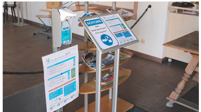
Seit Montag wurde der Publikumsverkehr deutlich reduziert und weitere Schutzmaßnahmen umgesetzt. Ab Mittwoch kommen Bürgerinnen und Bürger nur nach vorheriger Terminvereinbarung in die Verwaltungsgebäude.